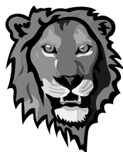
Рис. 1. Рисунок испытуемого.

Требования к оформлению иллюстраций (рисунков, схем, чертежей). Количество иллюстраций должно быть достаточным для пояснения излагаемого текста. Если ширина рисунка больше 8 см, то его располагают симметрично посередине. Если его ширина менее 8 см, то рисунок, как правило, располагают с краю, в обрамлении текста. Допускается размещение нескольких иллюстраций на одном листе.