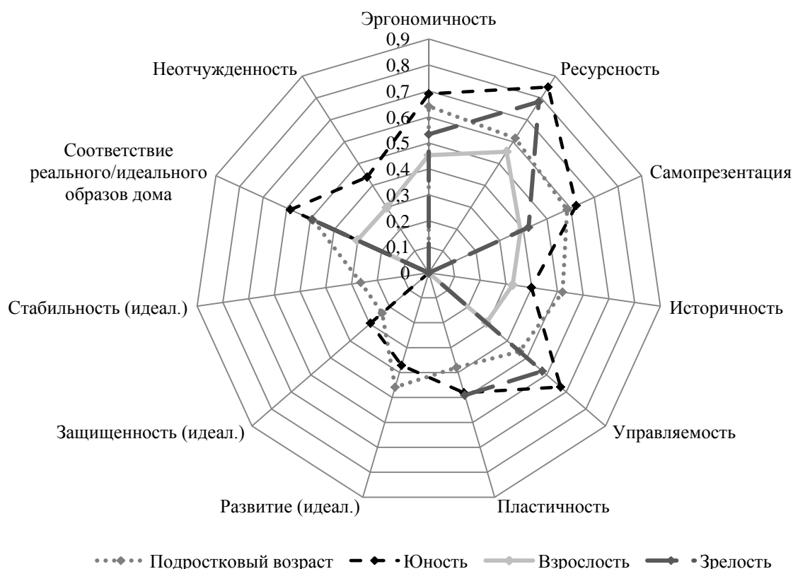
Рис. 1. Вклад характеристик образов реального и идеального дома в Привязанность к дому в разные возрастные периоды

Проверка гипотезы о вариативности показателей основных переменных в зависимости от возрастного фактора при помощи ANOVA (ДЗР Тьюки) показала, что подростки и юноши более восприимчивы (имеют наибольшее количество достоверно значимых различий), чем люди старшего возраста, к характеристикам домашней среды. Корреляционно-регрессионный анализ показал, что в подростковом возрасте образ идеального дома важен для формирования Привязанности, но с возрастом его потенциал ослабевает и к периоду взрослости перестает влиять на Привязанность к дому (рис. 1).