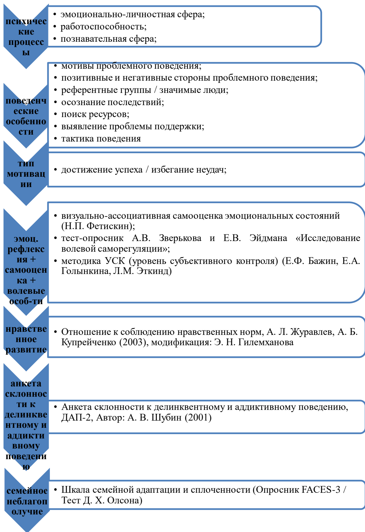
рис. 1. Логистика проведения психолого-педагогической оценки проявлений делинквентного поведения