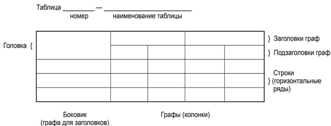
Таблица оформляется в соответствии с рисунком ниже.

Таблицы, за исключением таблиц приложений, следует нумеровать арабскими цифрами сквозной нумерацией. Таблицы каждого приложения обозначаются отдельной нумерацией арабскими цифрами с добавлением перед цифрой обозначения приложения. Если в отчете одна таблица, она должна быть обозначена «Таблица 1» или «Таблица А.1» (если она приведена в приложении А).