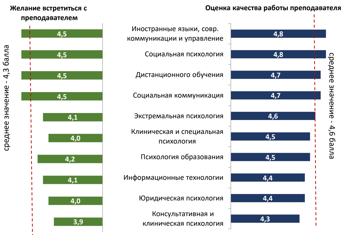
Рисунок 1.1. Оценка преподавания на факультетах МГППУ

Самые высокие оценки получили преподаватели с института "Иностранные языки, современные коммуникации и управление" и факультета «Социальная психология» (качество работы – 4,8 балла каждый, желание встретиться – 4,5 балла). Факультет «Социальная психология» в предыдущем опросе занимал низкую ступень рейтинга факультетов по качеству работы. В текущем, напротив, стал лидером.