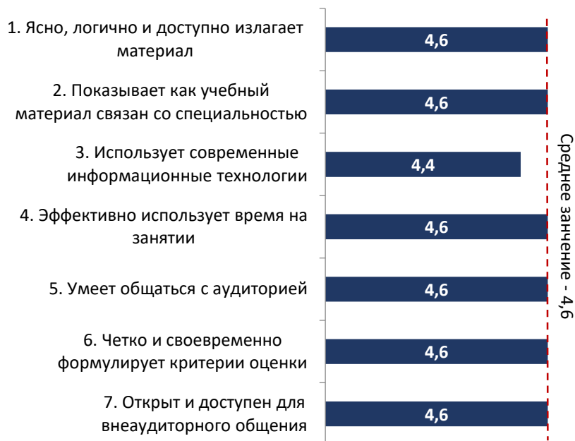
Рисунок 1.2. Оценка преподавания по отдельным критериям

Согласно данным студенческого опроса, все преподаватели МГППУ (269 человек, по которым набралось необходимое количество анкет) получили высокие оценки – нижняя граница оценок составила 3,4 балла. Только у 15 преподавателей средние оценки не превышают 4,0 балла.