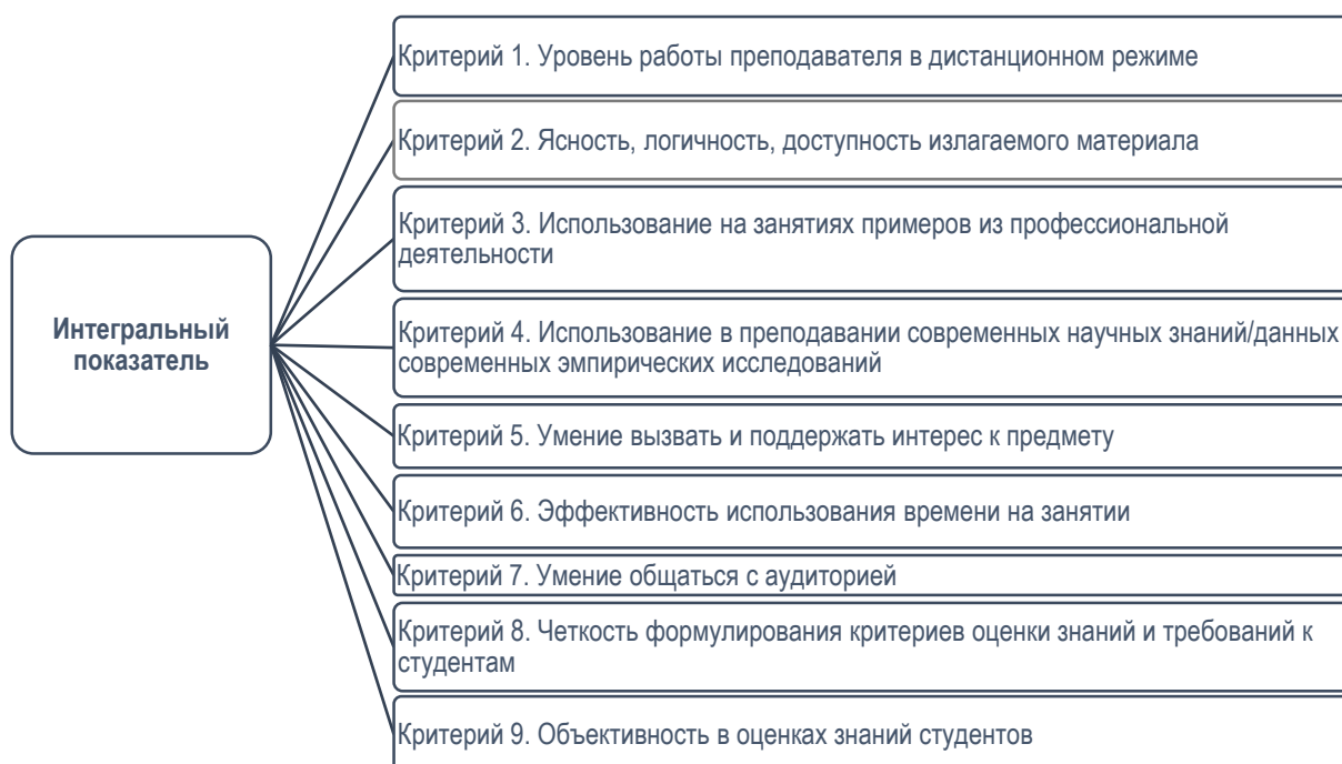
Схема 2.1. Построение интегрального показателя оценки качества работы преподавателей университета

Напомним, что в расчете итоговых оценок преподавателей общеуниверситетских кафедр «Зарубежная и русская филология» и «Физическая культура и ОБЖ» критерий 4 «Использование в преподавании современных научных знаний/данных современных эмпирических исследований» не учитывался.