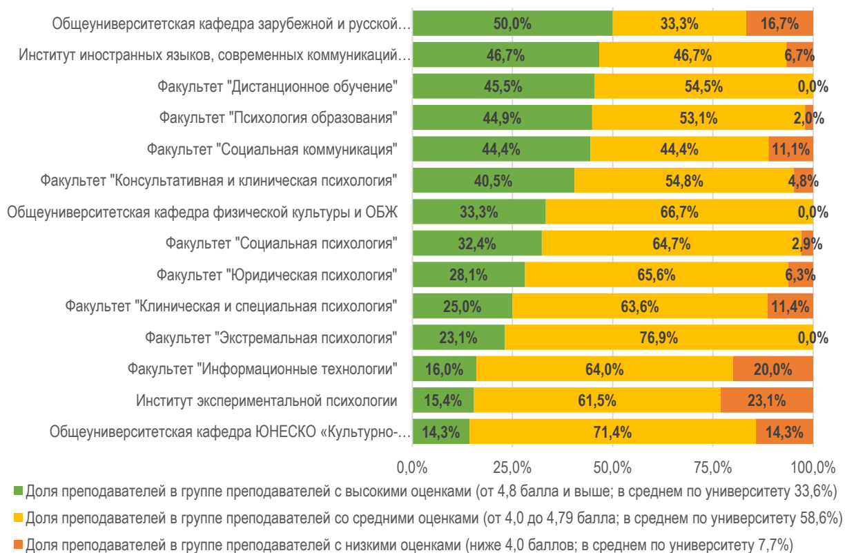
Рисунок 2.3.2. Распределение преподавателей по группам оценок в зависимости от учебного подразделения университета

Представим распределение преподавателей университета по группам оценок в зависимости от учебного подразделения (рис. 2.3.2).