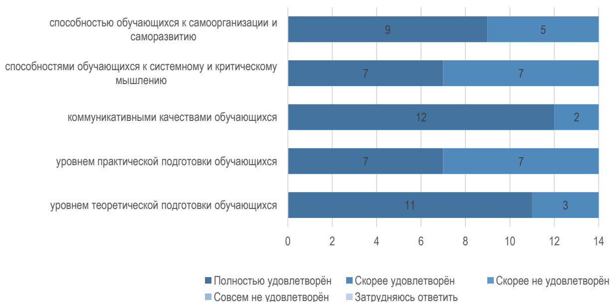
Рис. 2.2. Удовлетворенность работодателей уровнем подготовки обучающихся МГППУ

Наиболее высоко в организациях/предприятиях в обучающихся МГППУ оценивают коммуникативные качества и уровень теоретической подготовки (рис. 2.2). Несколько ниже работодатели оценивают в обучающихся способности к системного и критическому мышлению и уровень практической подготовки. Тем не менее, все предложенные аспекты работодателями были оценены на уровне «полностью удовлетворен» и «скорее удовлетворен». Ни в одной организации/предприятии в анкетировании не были выбраны варианты ответов «скорее не удовлетворен» или «совсем не удовлетворен».