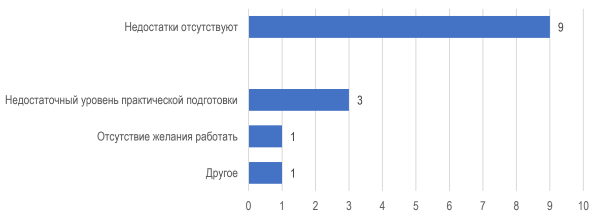
Рис. 2.3. Слабые стороны обучающихся МГППУ: оценка работодателей

В 9 из 14 организациях/предприятиях не смогли указать на недостатки в подготовке обучающихся университетом. Лишь только в одном случае работодатель отметил нежелание обучающихся работать, а в трех организациях к числу слабых сторон подготовки обучающихся отнесли недостаточный уровень практической подготовки (рис. 2.4). В одной организации возникли сложности с оценкой по данному вопросу, ссылаясь на то, что студенческие группы достаточно разнородные, но тем не менее явных недостатков работодателем выявлено не было.