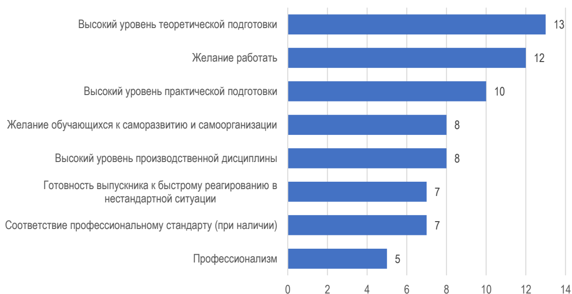
Рис. 2.3. Сильные стороны обучающихся МГППУ: оценка работодателей

В 9 из 14 организациях/предприятиях не смогли указать на недостатки в подготовке обучающихся университетом. Лишь только в одном случае работодатель отметил нежелание обучающихся работать, а в трех организациях к числу слабых сторон подготовки обучающихся отнесли недостаточный уровень практической подготовки (рис. 2.4). В одной организации возникли сложности с оценкой по данному вопросу, ссылаясь на то, что студенческие группы достаточно разнородные, но тем не менее явных недостатков работодателем выявлено не было.