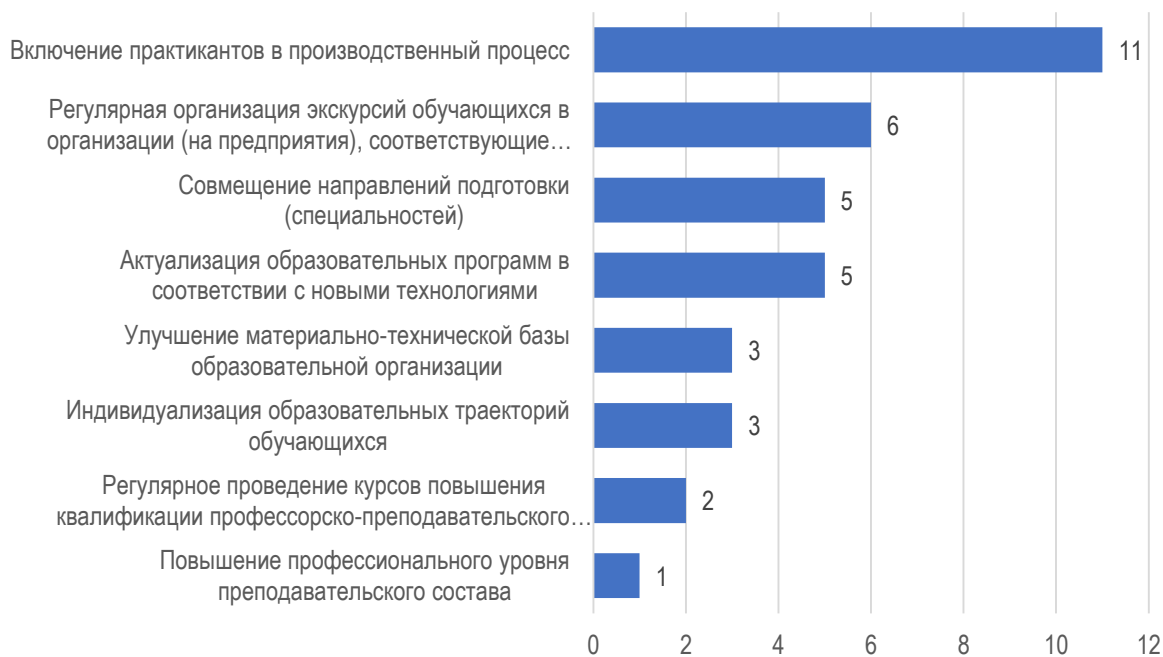
Рис. 3.1. Предложения по изменению образовательной программы: оценка работодателя

благоприятно способствовать регулярные экскурсии обучающихся в организации/предприятиях. Только в одной организации предложили повысить профессиональный уровень преподавательского состава (рис. 3.1).