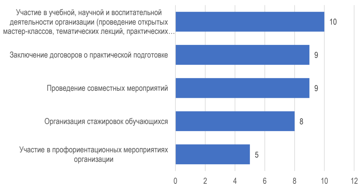
Рис. 4.1. Формы взаимодействия работодателей с университетом

В 10 из 14 организациях хотели развивать сотрудничество с МГППУ в форме участия в учебной, научной и воспитательной деятельности, речь идет о проведение открытых мастер-классов, тематических лекций, практических занятий, научных мероприятиях и др. (рис. 4.1). В 9 организациях готовы предоставить свои площадки для прохождения студентами практической подготовки, а также проводить совместные мероприятия. В 8 организациях готовы организовать стажировки для студентов. В 5 организациях выразили желание принимать студентов в профориентационных мероприятиях организации.