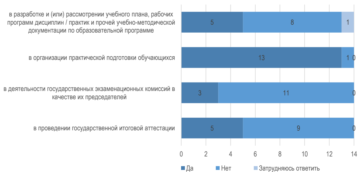
Рис. 1.1. Участие организаций/предприятий в деятельности университета