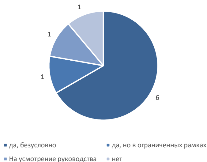
Рис. 4. Перспективы развития деловых связей и сотрудничества организаций с МГППУ

К числу основных форм развития деловых связей и сотрудничества организаций с университетом работодатели отнесли участие в учебной, научной и воспитательной деятельности организации, заключение договоров о практической подготовке и организацию стажировок для обучающихся (рис. 5).