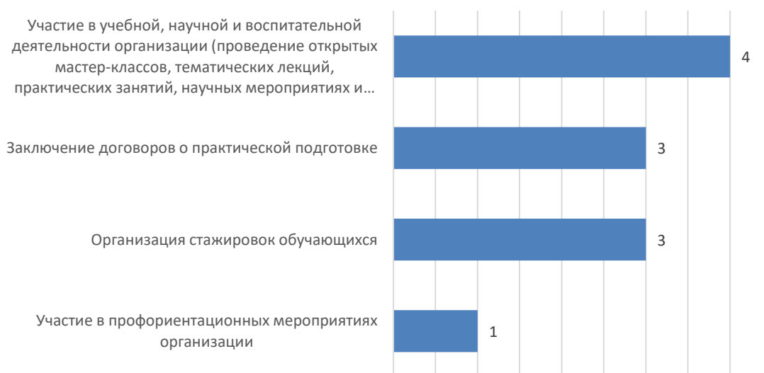
Рис. 5. Перспективы развития деловых связей и сотрудничества организаций с МГППУ

К числу основных форм развития деловых связей и сотрудничества организаций с университетом работодатели отнесли участие в учебной, научной и воспитательной деятельности организации, заключение договоров о практической подготовке и организацию стажировок для обучающихся (рис. 5).