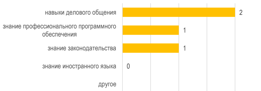
Рис. 3.2. Необходимые знания и умения при трудоустройстве студентов: оценка работодателя