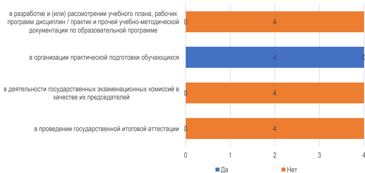
Рис. 1.1. Участие организаций в деятельности университета

Взаимодействие организаций с университетом носит односторонний характер – только на уровне предоставления площадок для проведения практической подготовки обучающимся университета (рис. 1.1).