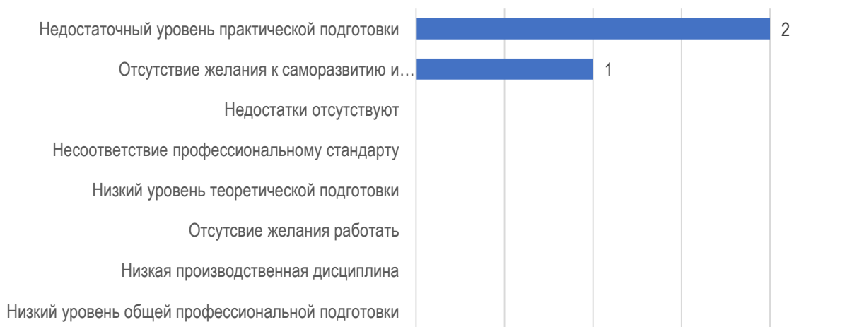
Рис. 2.4. Слабые стороны обучающихся МГППУ: оценка работодателей