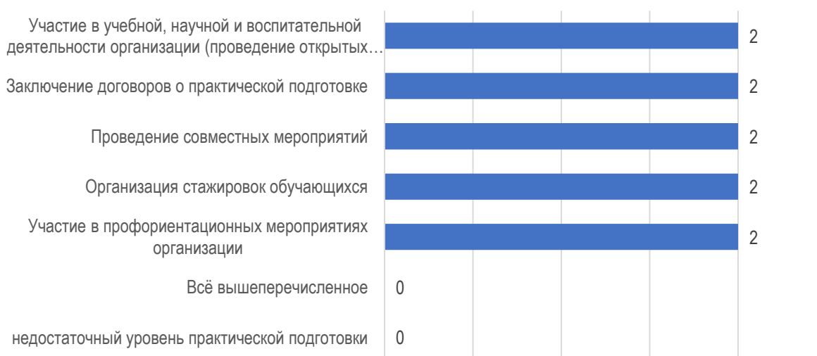
Рис. 4.1. Формы взаимодействия работодателей с университетом

Помимо этого, все организации намерены и дальше развивать деловые связи и сотрудничество с университетом, но, разумеется, в разных формах: это и участие в учебной, научной и воспитательной деятельности организации, и пролонгация договоров о практической подготовке, и проведение совместных мероприятий, и организация стажировок для обучающихся, и участие в профориентированных мероприятиях организации (рис. 4.1).