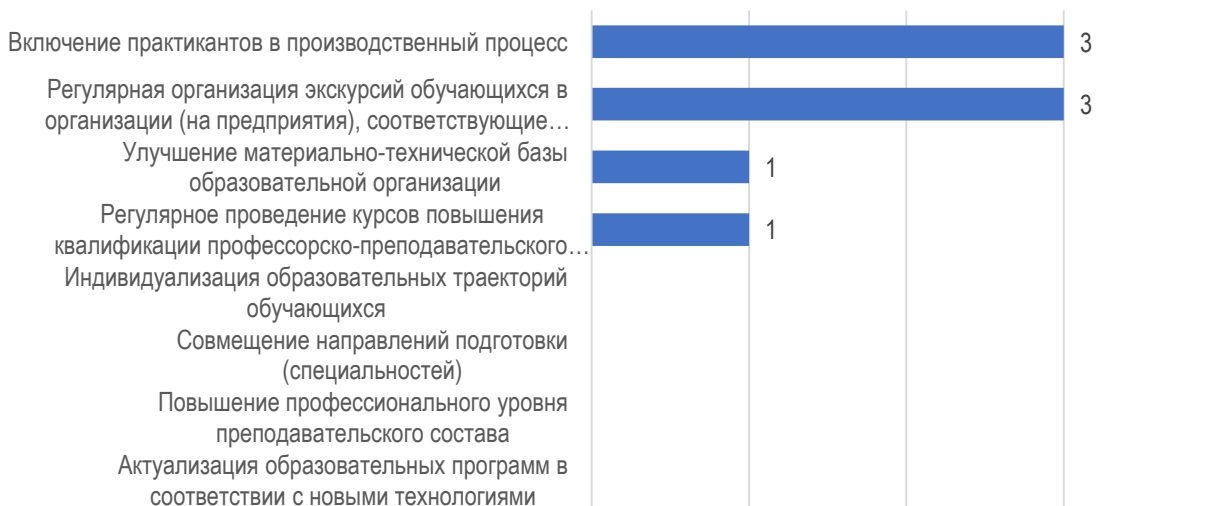
Рис. 3.1. Предложения по изменению образовательной программы: оценка работодателя

Для повышения качества подготовки обучающихся в МГППУ организации предлагают в первую очередь включение практикантов в производственный процесс, а также проведение регулярных экскурсий для обучающихся в организации, соответствующие направлению подготовки (рис. 3.1). Кроме этого, повышению подготовки также может способствовать улучшение материально-технической базы университета и регулярное проведение курсов повышения квалификации профессорско-преподавательского состава.