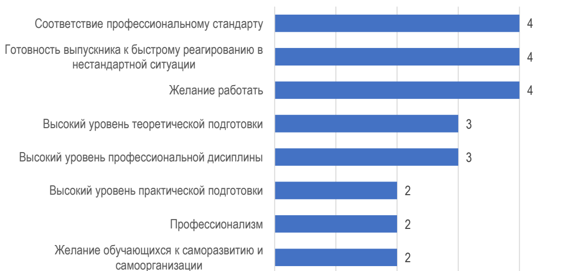
Рис. 2.3. Сильные стороны обучающихся МГППУ: оценка работодателей

К числу сильных сторон подготовки обучающихся МГППУ все работодатели отнесли соответствие уровня обучающихся профессиональному стандарту, готовность выпускников к быстрому реагированию в нестандартных ситуациях и желание работать (рис. 2.3). Реже работодатели отмечают высокий уровень практической подготовки, профессионализм и стремление студентов к саморазвитию и самоорганизации.