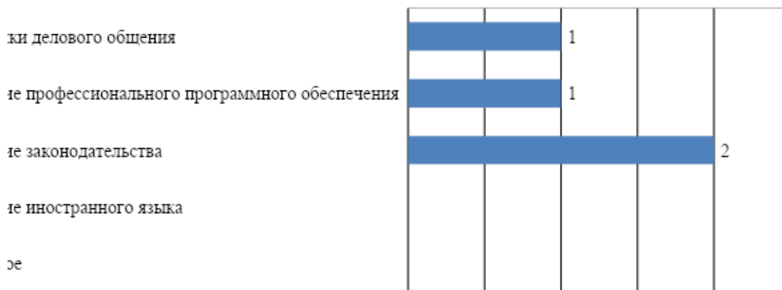
Рис. 1. Дополнительные знания и умения обучающихся необходимые для успешного трудоустройства.

К числу основных сильных сторон подготовки обучающихся МГППУ работодатели в первую очередь относят: высокий уровень практической подготовки, а также соответствие профессиональному стандарту, высокий уровень теоретической подготовки, желание обучающихся к саморазвитию и самоорганизации, желание работать и профессионализм (рис. 2). Респонденты не упоминали в качестве сильных сторон подготовки обучающихся университета высокий уровень производственной дисциплины, готовность выпускника к быстрому реагированию в нестандартной ситуации.