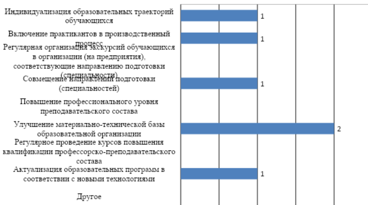
Рис. 4. . Изменения, которые необходимо внести в образовательный процесс по программе для повышения качества подготовки обучающихся

Для повышения эффективности подготовки обучающихся работодатели рекомендовали, в первую очередь, улучшить материально-техническую базу образовательной организации; включить практикантов в производственный процесс; организовать совмещение направлений подготовки (специальностей); актуализировать образовательные программы в соответствии с новыми технологиями, индивидуализировать образовательные траектории обучающихся (рис. 4).