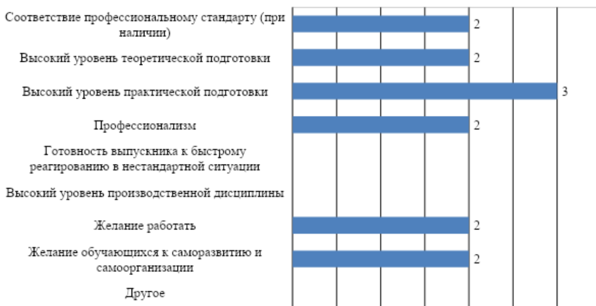
Рис. 2. Оценка работодателей: сильные стороны подготовки обучающихся университета

К числу основных сильных сторон подготовки обучающихся МГППУ работодатели в первую очередь относят: высокий уровень практической подготовки, а также соответствие профессиональному стандарту, высокий уровень теоретической подготовки, желание обучающихся к саморазвитию и самоорганизации, желание работать и профессионализм (рис. 2). Респонденты не упоминали в качестве сильных сторон подготовки обучающихся университета высокий уровень производственной дисциплины, готовность выпускника к быстрому реагированию в нестандартной ситуации.