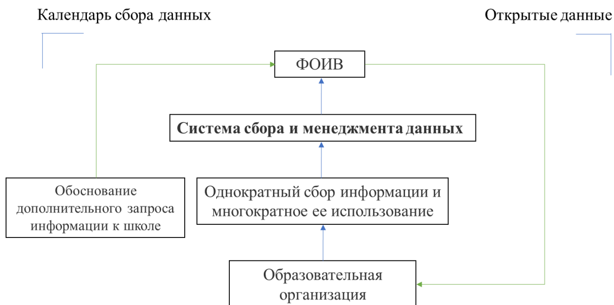
Схема 2. Совершенствование управленческих механизмов регулирования документарной нагрузки педагогов в общеобразовательной организации

По данным, полученным при анализе результатов анкетирования, почти у 40 % опрошенных педагогов общеобразовательных организаций значительное время затрачивается на подготовку обязательных документов в ущерб взаимодействию с обучающимися в классе или в рамках внеурочной деятельности. В то же время лишь каждый пятый респондент подтвердил, что основное время посвящено работе с обучающимися в классе или в рамках внеурочной деятельности. В общих трудозатратах педагогов на подготовку и оформление документов лишь у 40 % респондентов более половины трудозатрат касаются подготовки и оформления документов, непосредственно связанных с содержанием и результатами педагогической работы. В общей структуре временных затрат педагогов на оформление документов, отражающих содержание и результаты педагогической работы, меньше всего времени отводится на работу с документами, направленными на индивидуализацию обучения (индивидуальные планы работы с разными категориями обучающихся).